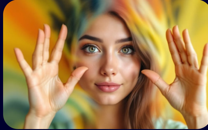
Figura do 8

Cobrir os olhos com as mãos aquecidas por 5 minutos ajuda a relaxar os músculos oculares, reduzir a tensão e aliviar o cansaço visual após longos períodos de trabalho com telas.